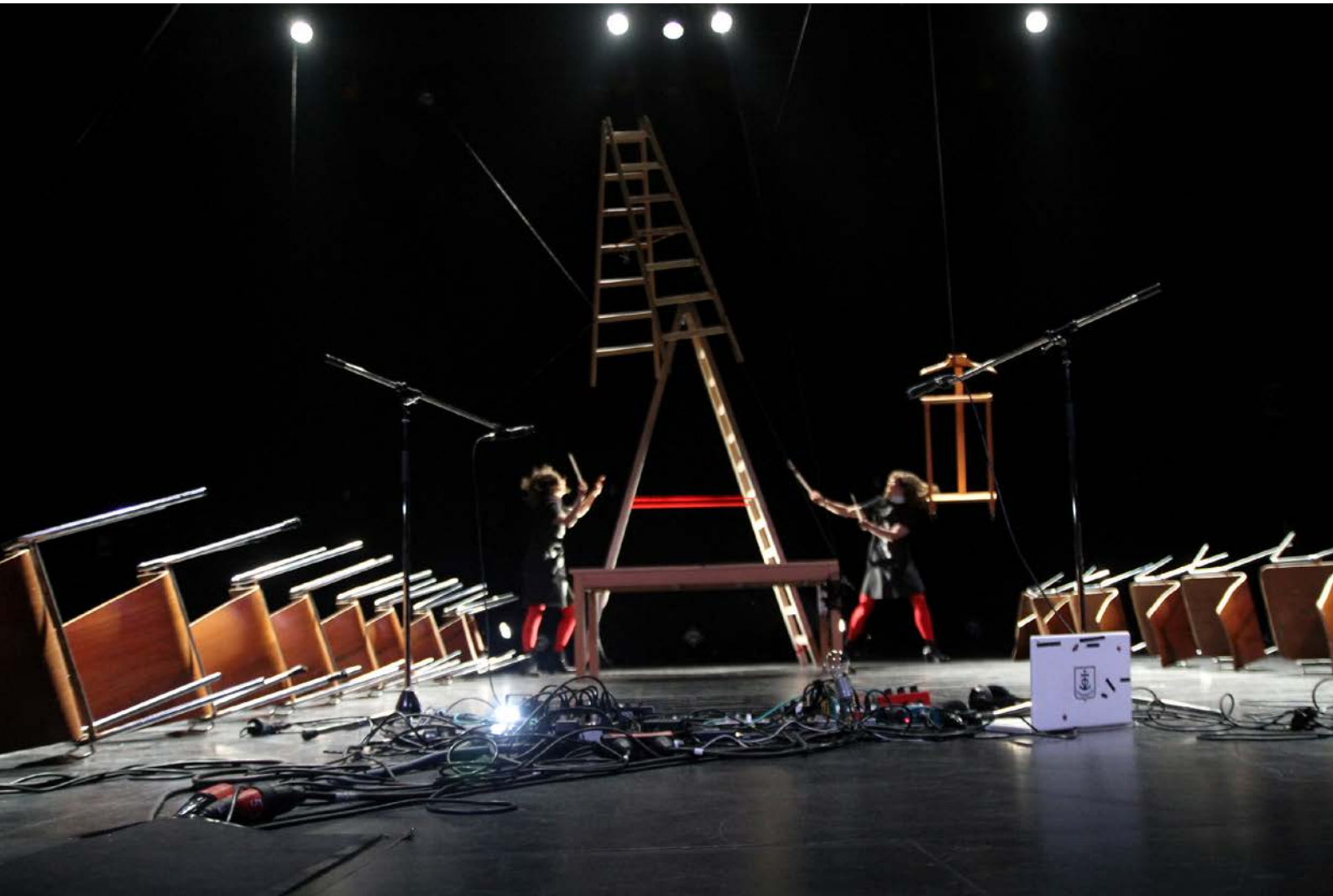
SKILLS – DER AUFBAU, Regie: Skills, Hebbel am Ufer, 2013