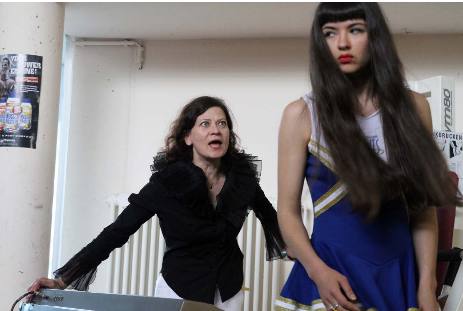
UNENDLICHER SPASS – 24 STUNDEN DURCH DEN UTOPISCHEN WESTEN, Regie: Peter Kastenmüller, LTTC "Rot-Weiss", Hebbel am Ufer, 2012