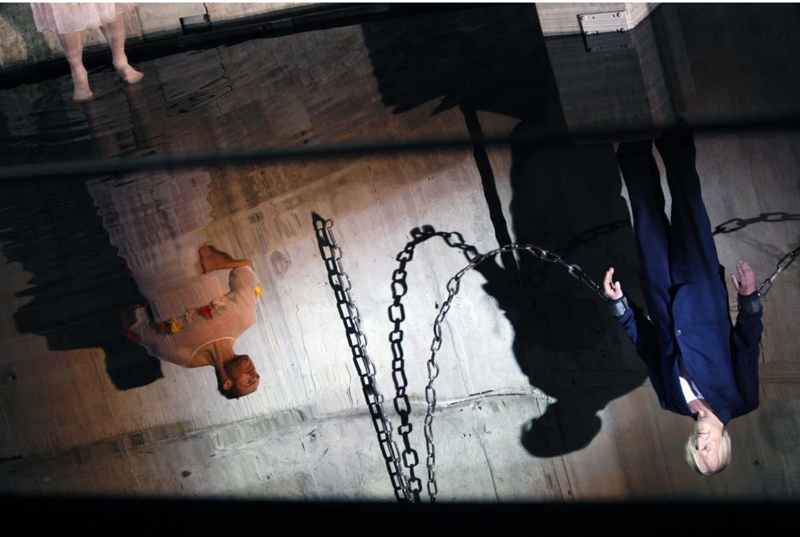
PROMETHEUS, GEFESSELT, Regie: Jossi Wieler, Schaubühne, 2009, © Dorothea Tuch