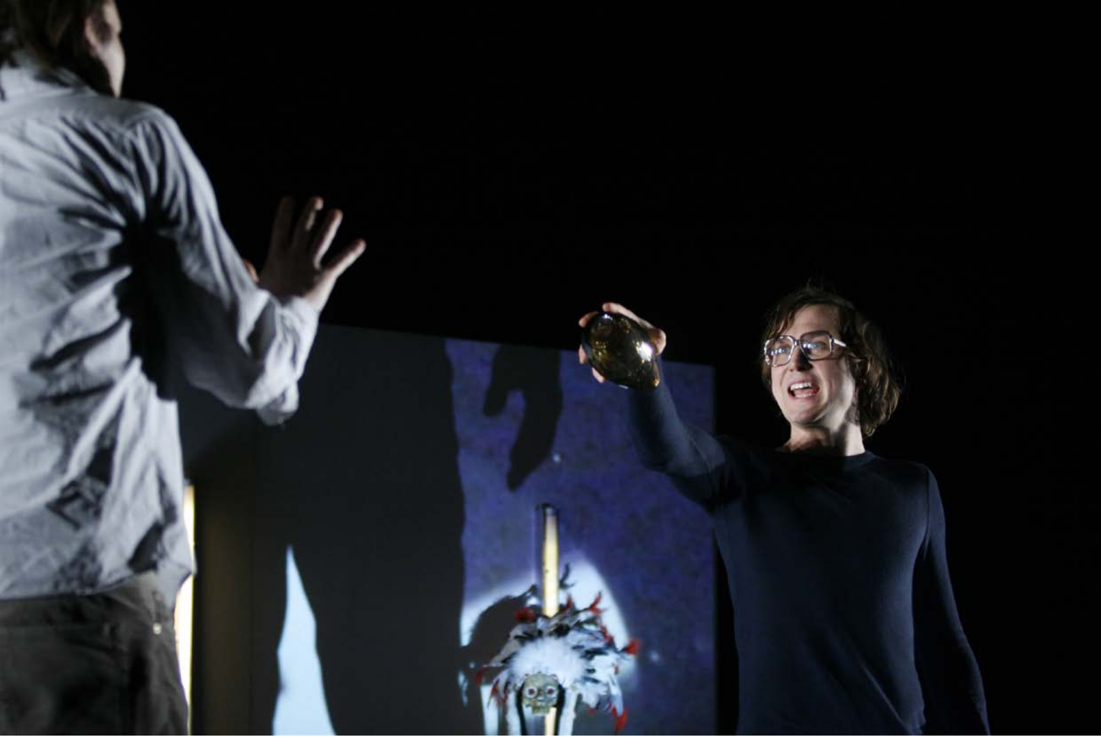
DÄMONEN, Regie: Thomas Ostermeier, Schaubühne, 2010, © Dorothea Tuch