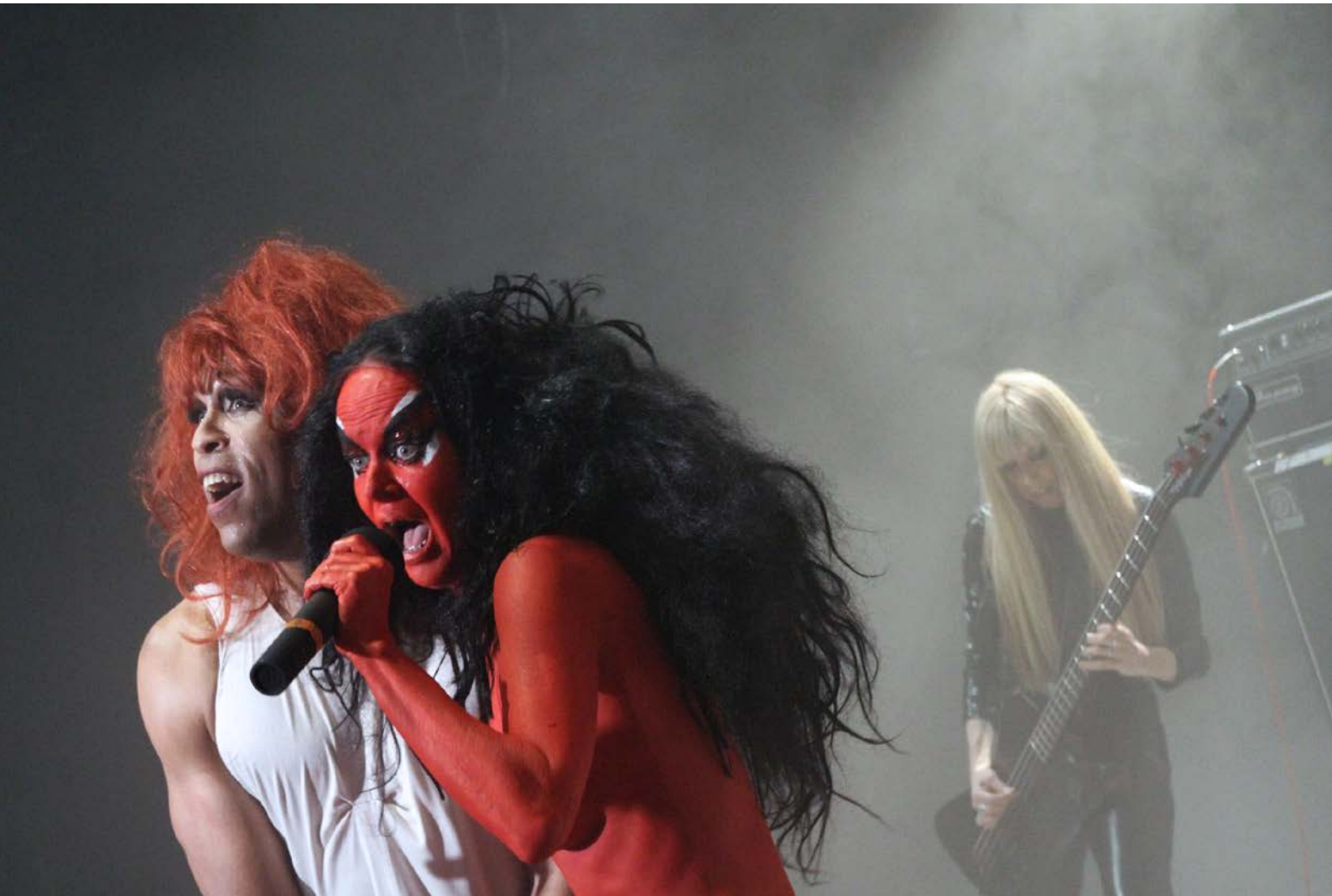
CAMP / ANTI-CAMP, Festival, Hebbel am Ufer, 2012