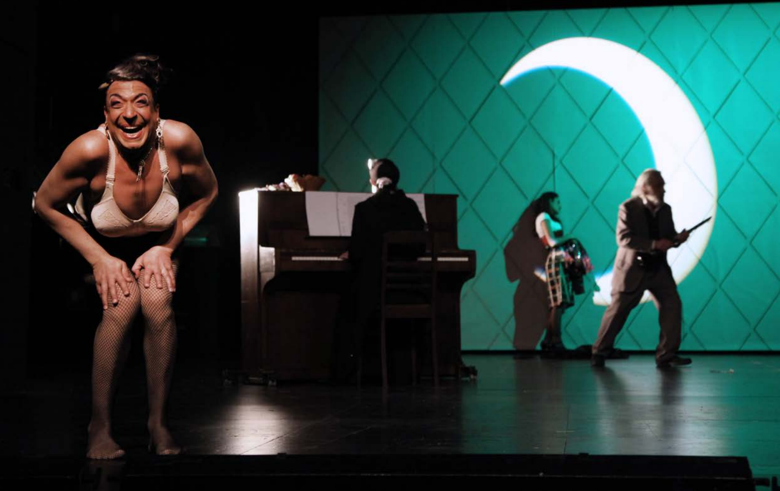
DER KIRSCHGARTEN, Regie: Nurkan Erpulat, Maxim Gorki Theater, 2013