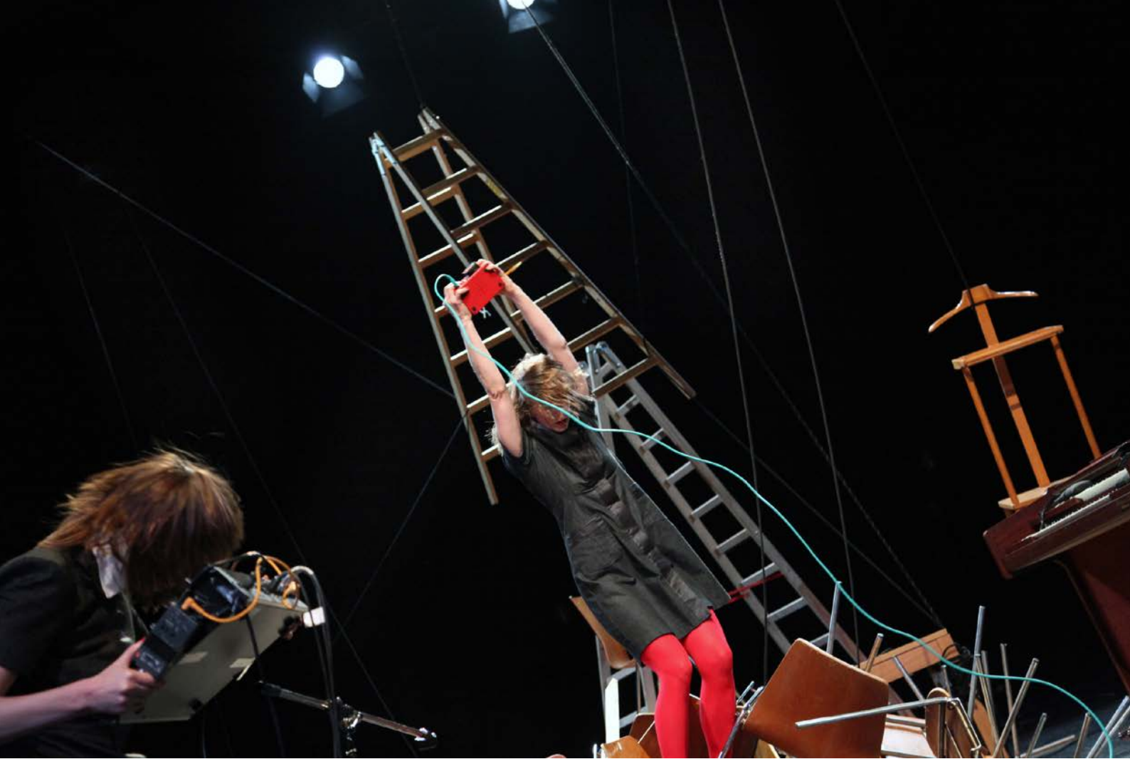
SKILLS – DER AUFBAU, Regie: Skills, Hebbel am Ufer, 2013, © Dorothea Tuch