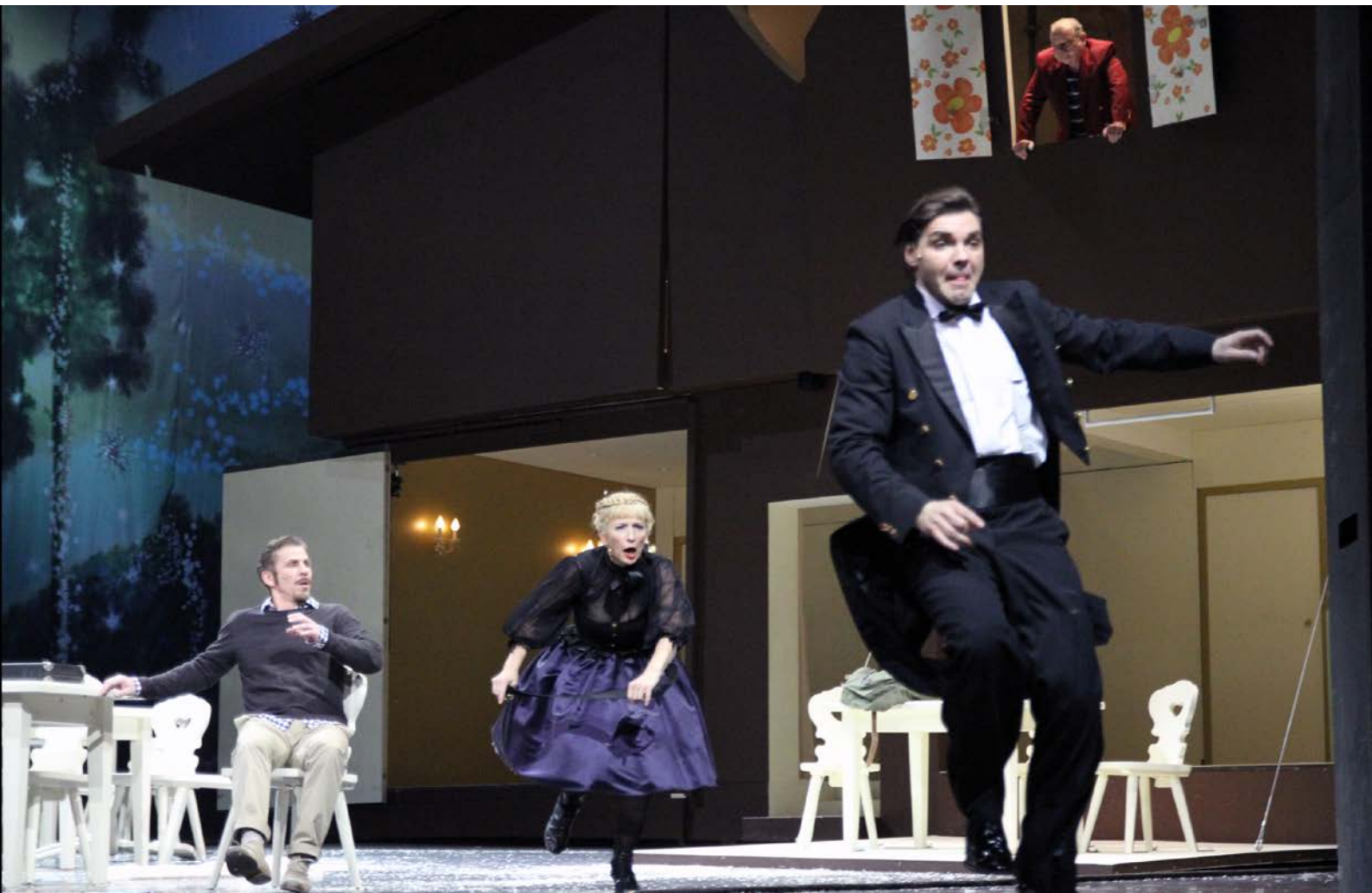
IM WEISSEN RÖSSL, Regie: Sebastian Baumgarten, Komische Oper, 2010, © Dorothea Tuch