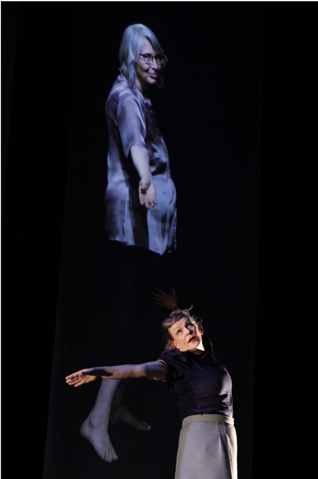
FRÜHLINGSOPFER, Konzept: She She Pop, Hebbel am Ufer, 2014, © Dorothea Tuch