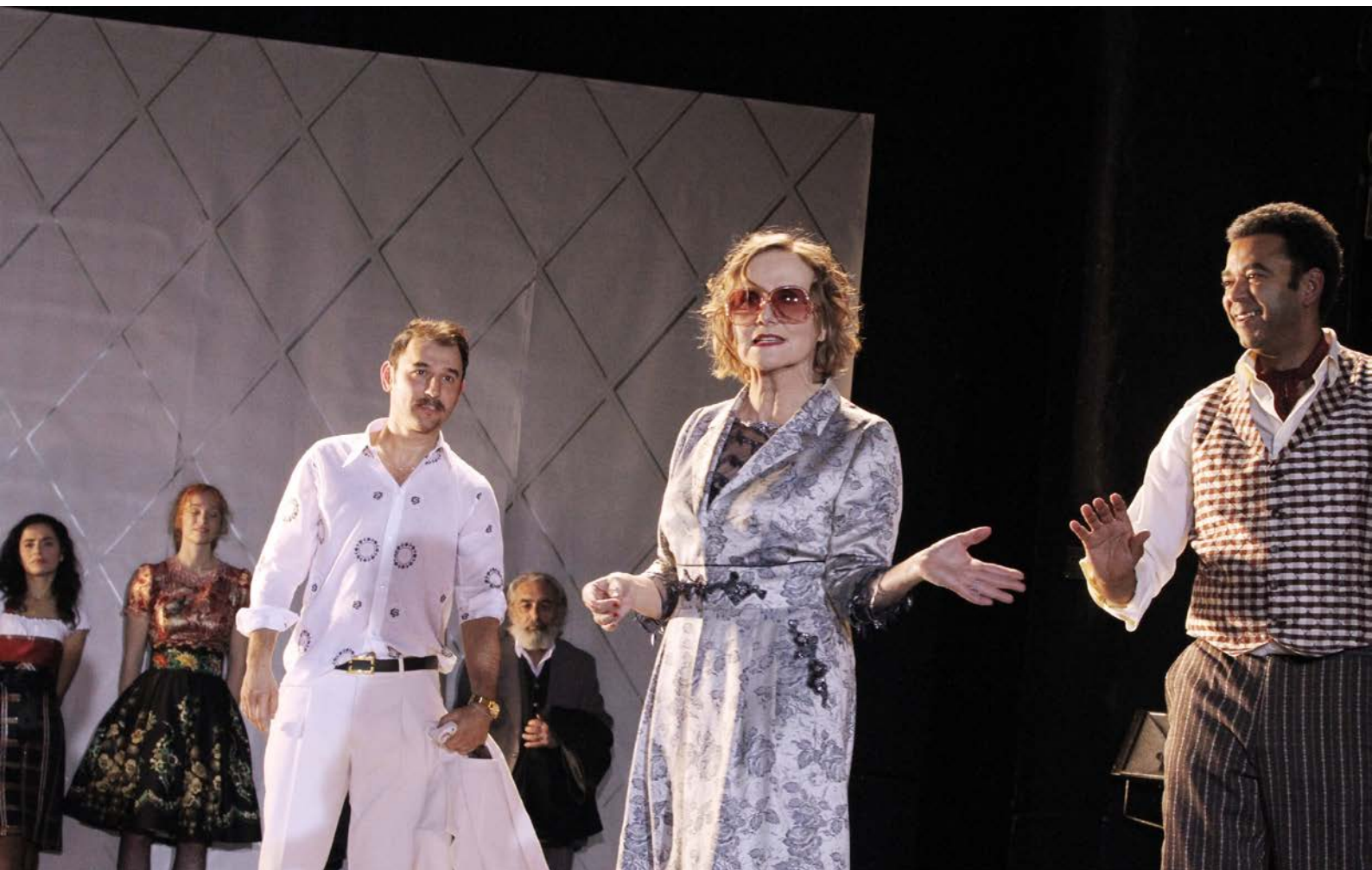
DER KIRSCHGARTEN, Regie: Nurkan Erpulat, Maxim Gorki Theater, 2013, © Dorothea Tuch