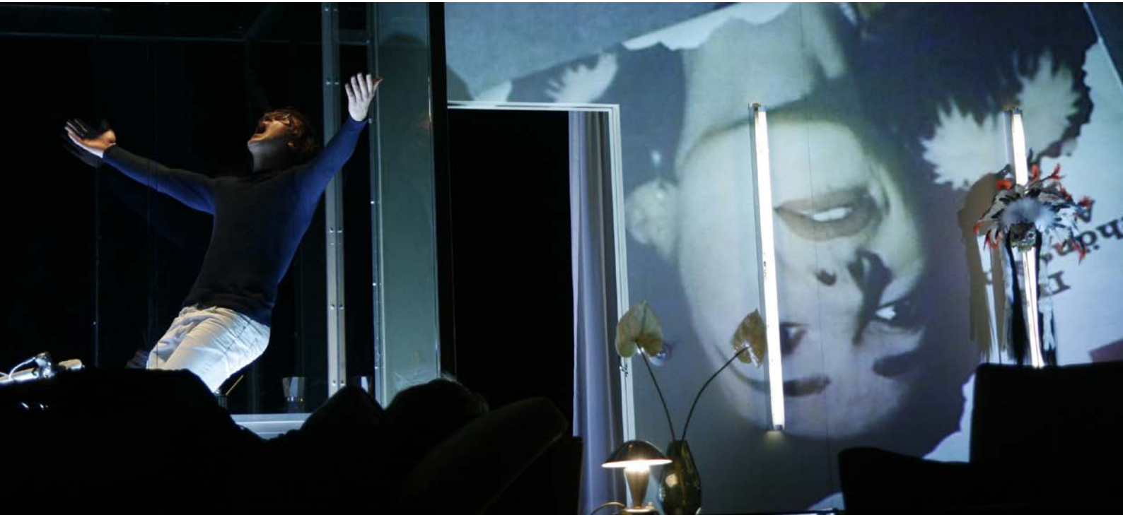
DÄMONEN, Regie: Thomas Ostermeier, Schaubühne, 2010