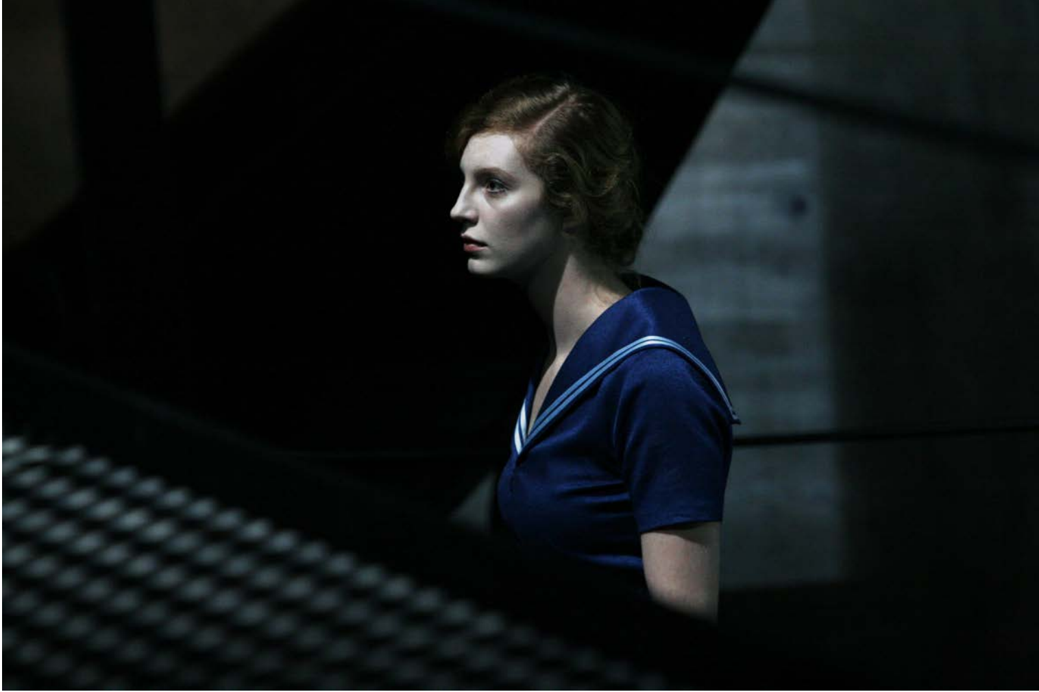
PROMETHEUS, GEFESSELT, Regie: Jossi Wieler, Schaubühne, 2009, © Dorothea Tuch