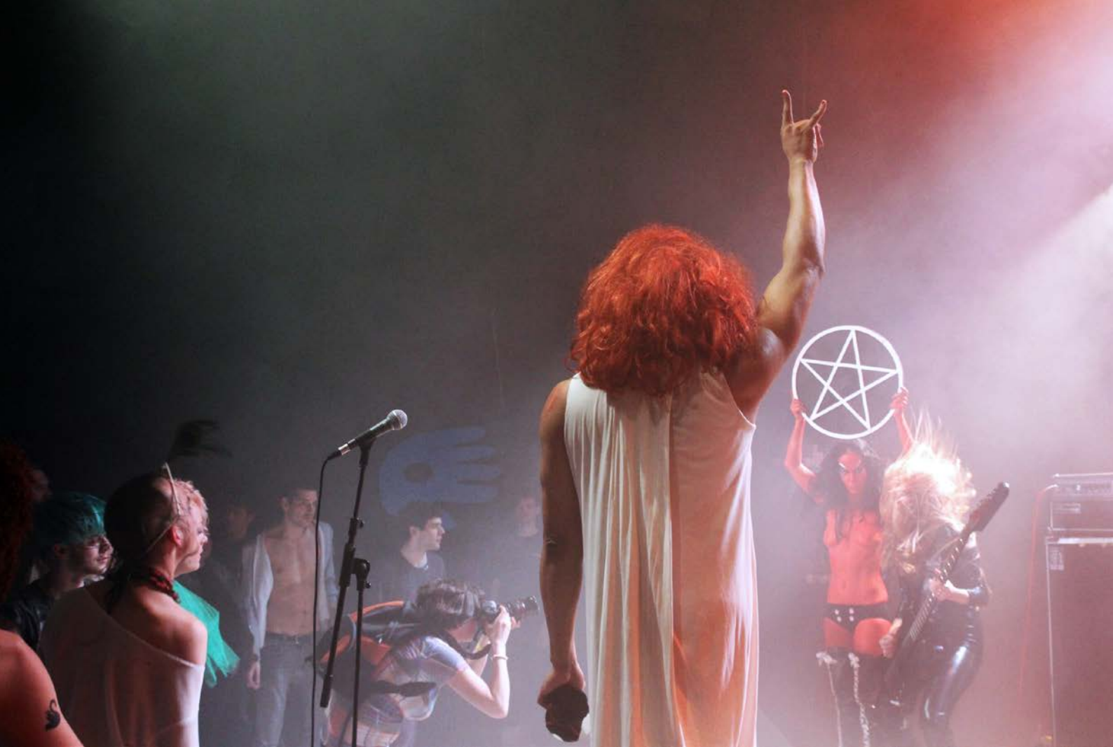
CAMP / ANTI-CAMP, Festival, Hebbel am Ufer, 2012, © Dorothea Tuch