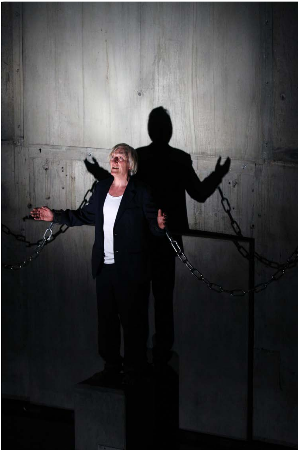
PROMETHEUS, GEFESSELT, Regie: Jossi Wieler, Schaubühne, 2009, © Dorothea Tuch