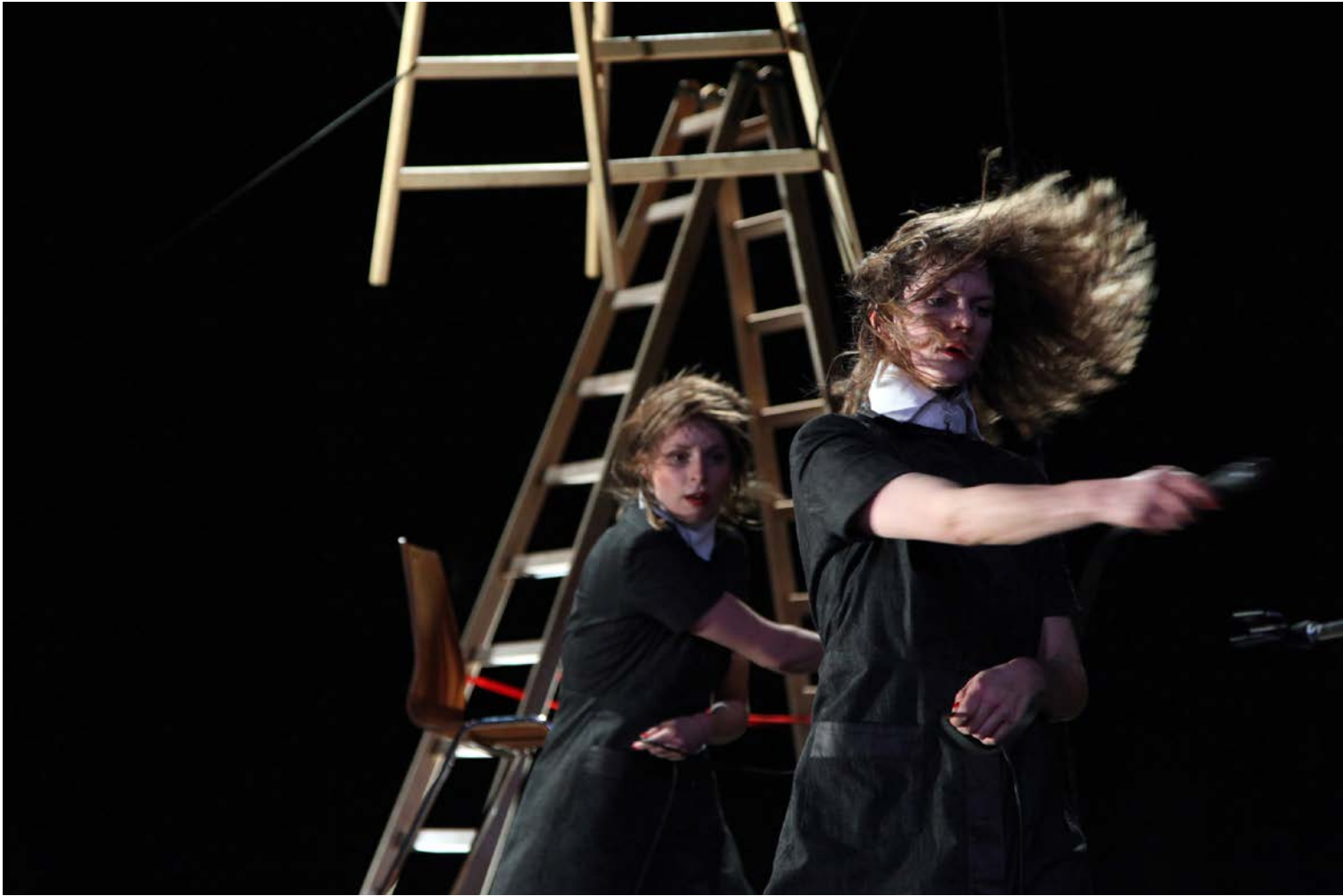
SKILLS – DER AUFBAU, Regie: Skills, Hebbel am Ufer, 2013, © Dorothea Tuch