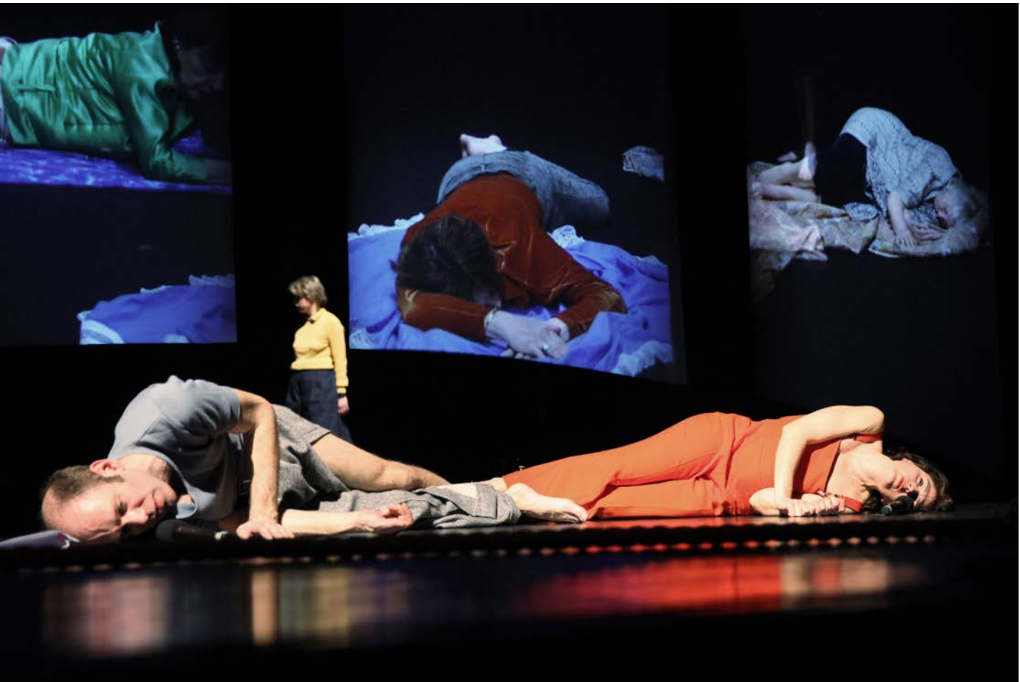
FRÜHLINGSOPFER, Konzept: She She Pop, Hebbel am Ufer, 2014, © Dorothea Tuch