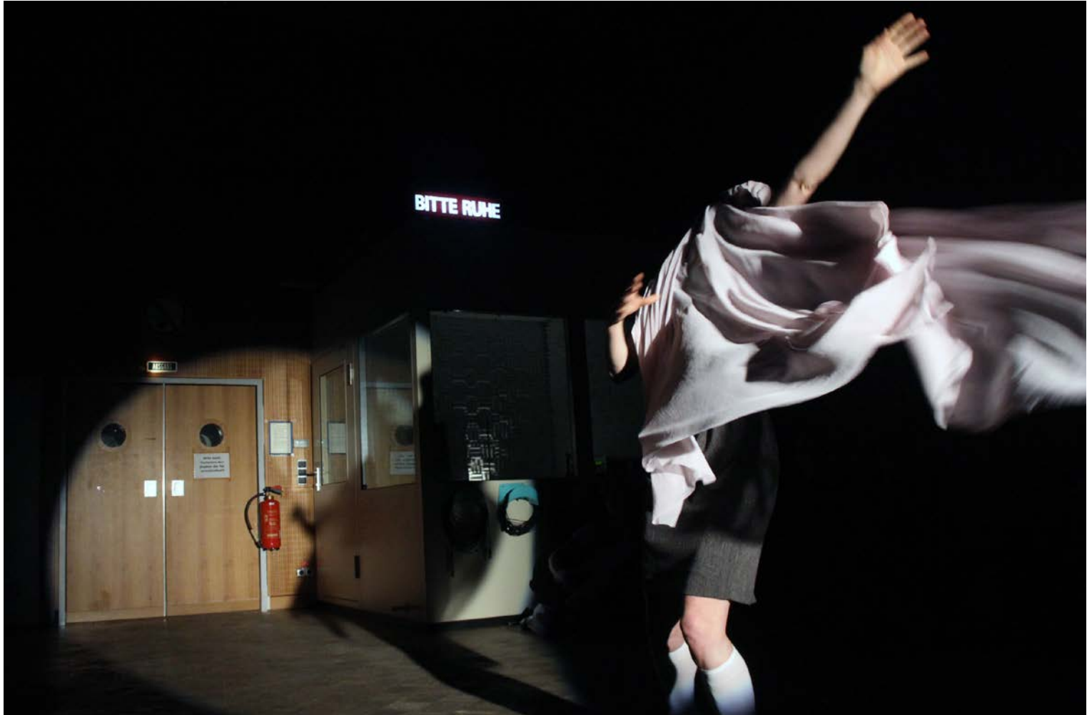
UNENDLICHER SPASS – 24 STUNDEN DURCH DEN UTOPISCHEN WESTEN, Regie: Anna-Sophie Mahler, Haus des Rundfunks, Hebbel am Ufer, 2012