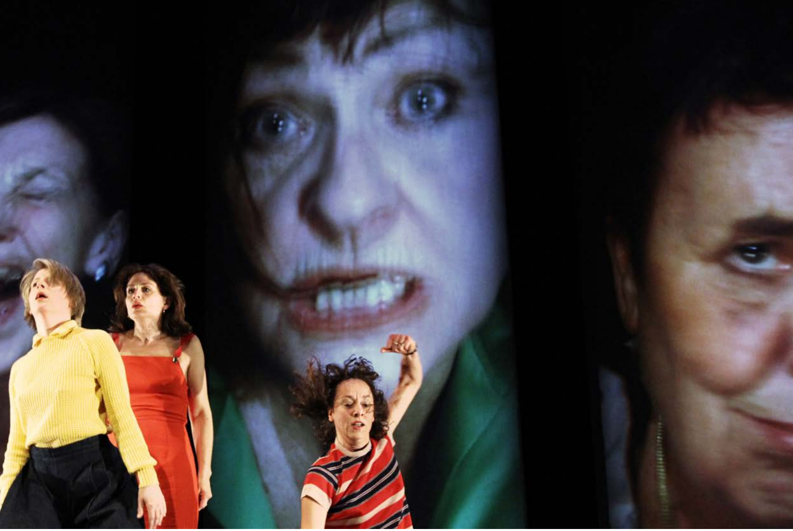
FRÜHLINGSOPFER, Konzept: She She Pop, Hebbel am Ufer, 2014