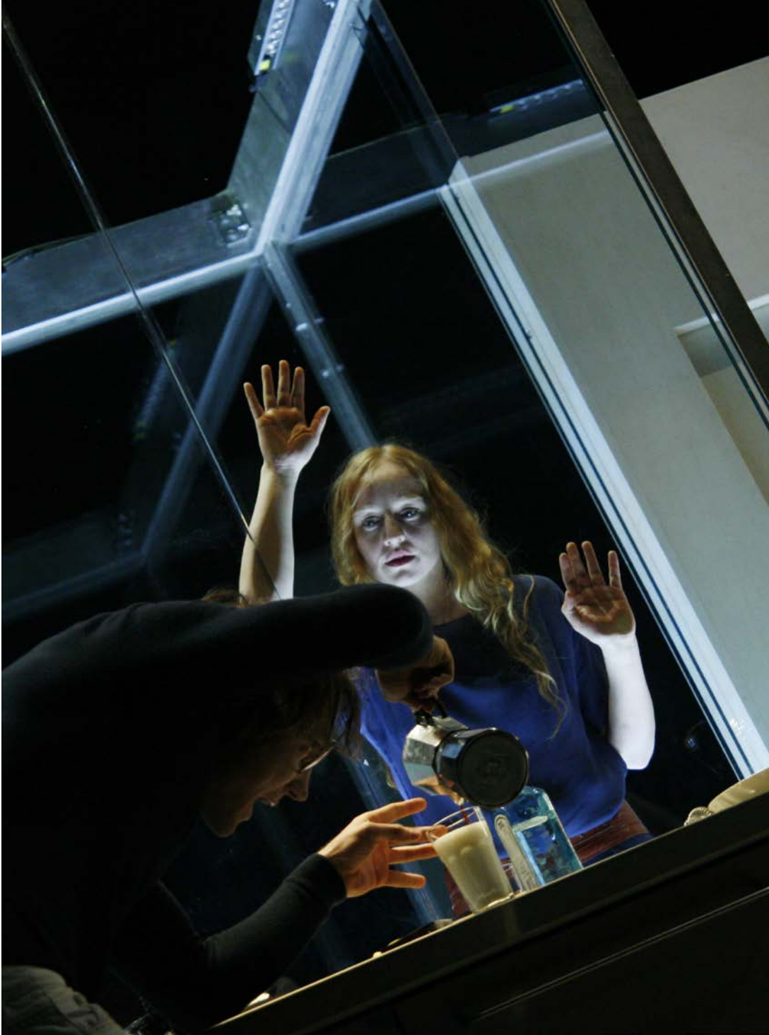
DÄMONEN, Regie: Thomas Ostermeier, Schaubühne, 2010